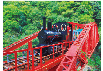
マイントピア別子のトロッコ