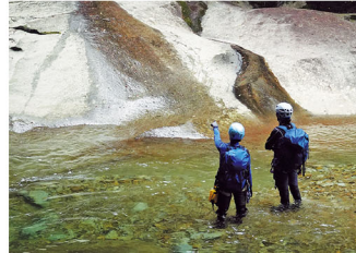
滑床溪谷のサマークライミング